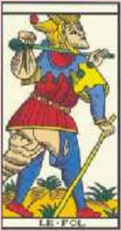
TARÔ DE MARSELHA